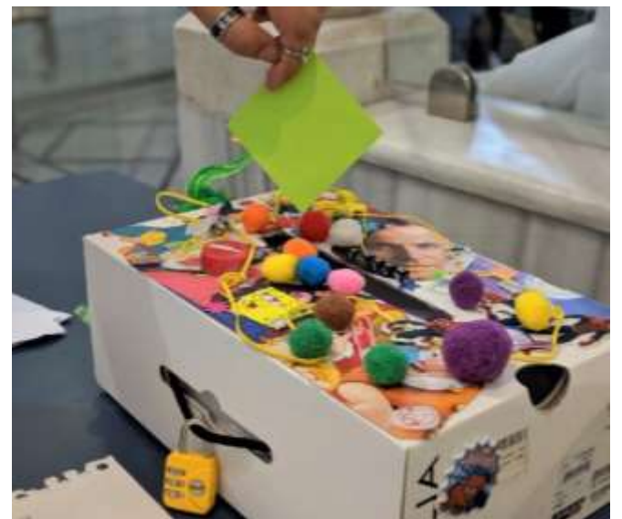
בתמונה: תיבת הוידוים המקורית

בחודש שעבר הוצבה במוזות תיבת וידוים שעוד לא נראתה בבית הספר. התיבה עוצבה בסגנון נקי ומינימליסטי (סגנון המוכר עם 'קימאיה' שהיו אחראיות על עיצובה) ונועדה למשוך את עיני התלמידים ולגרום להם לשלשל פתק עם וידוי חושפני על חיי היום יום שלהם במוזות. ההיענות לתיבת הוידוים הייתה מיידית והסודות הכמוסים החלו להחשף. מאות תלמידים חלקו סודות, התוודו, סיפרו את הסיפורים שמעולם לא ספרו. שבוע לאחר מכן התקיים יום הורים, התיבה נותרה במקומה והורים רבים חשו צורך לפרוק את שעל ליבם. מפתחת פתקי ההורים נודע לנו כי הורים לא מעטים התוודו כי היו רוצים להיות תלמידים במוזות. בעמוד 6 תוכלו לקרוא את הוידוים המצמררים של התלמידים ולנסות לנחש מי כתב מה.