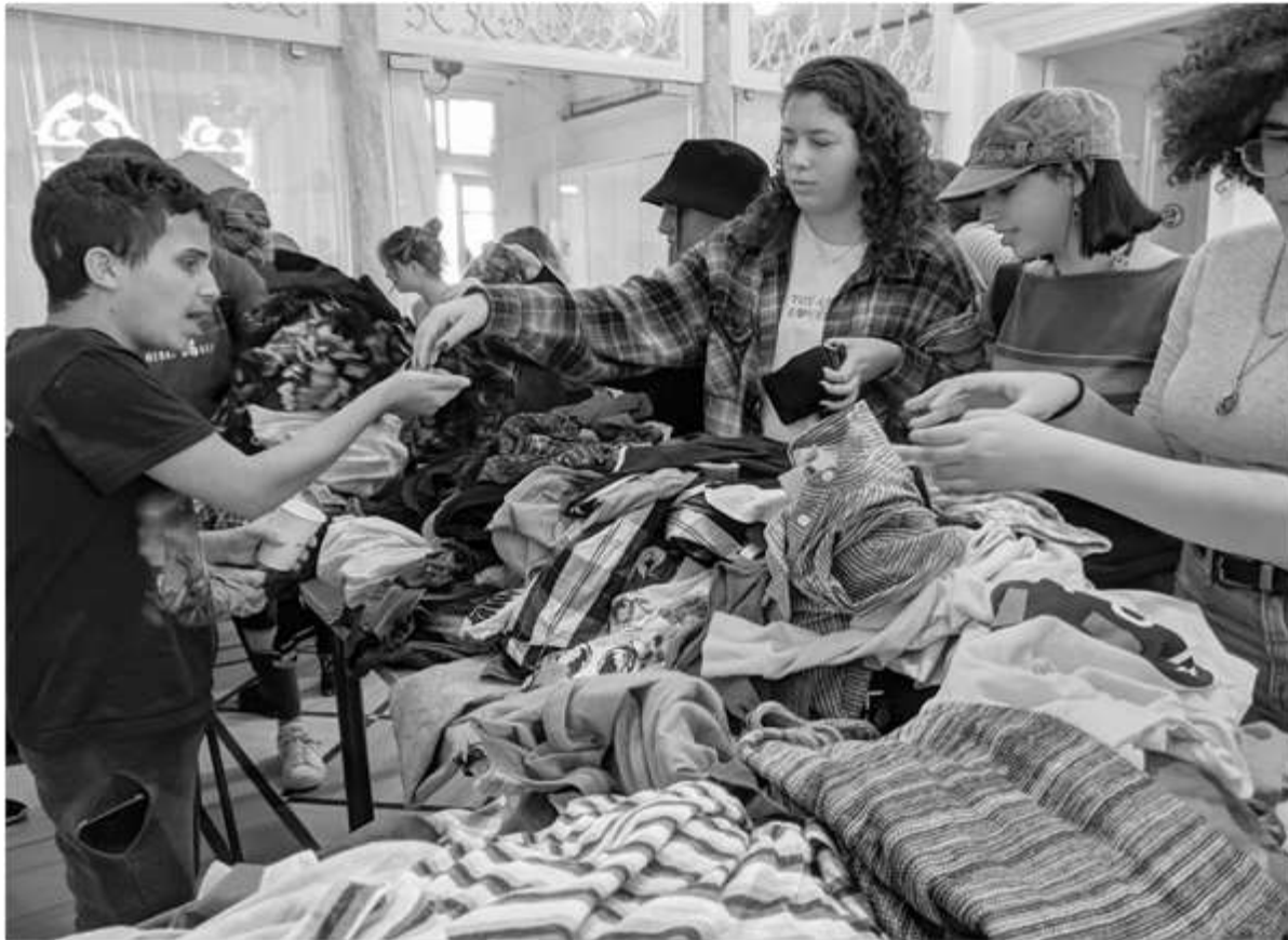
בתמונה: סחר חוקי בין תלמידים לתלמידים

תקשורת חופשית, איכותית ורכילותית במוזות – בי"ס תיכון לאמנויות